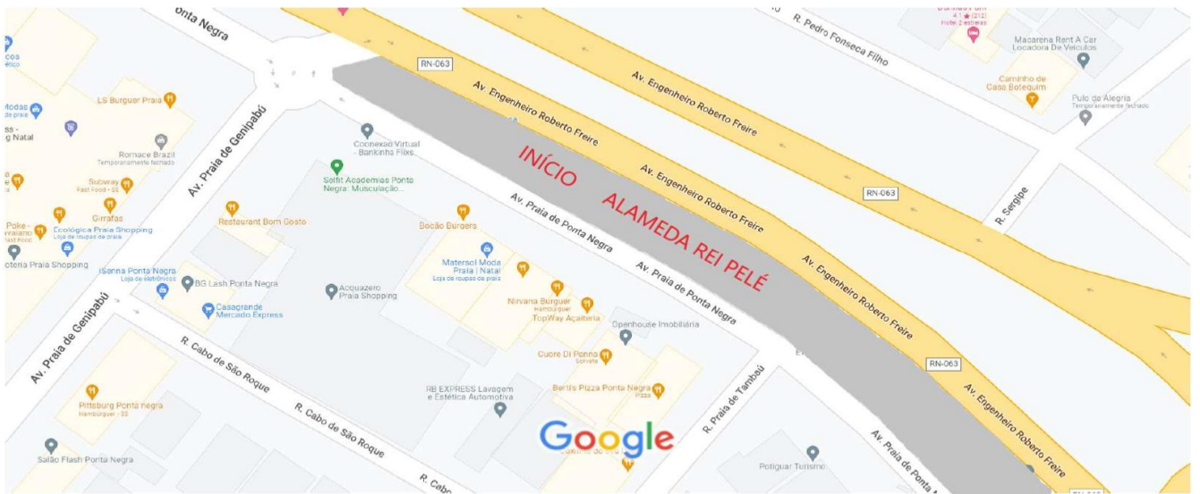
10 m